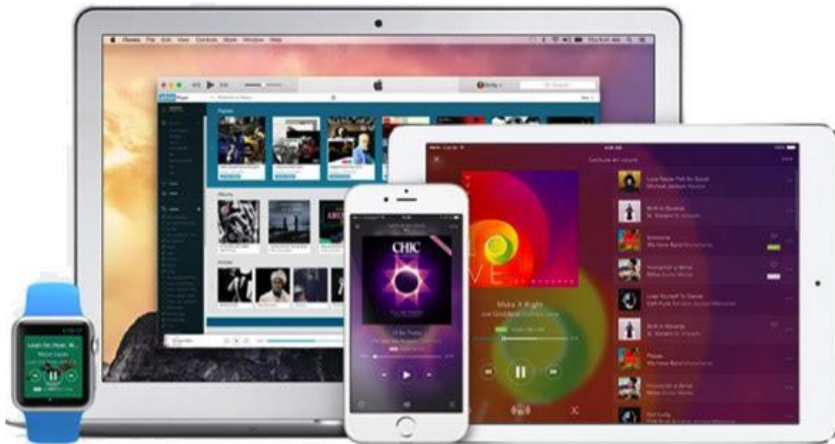
Die Qobuz Anwendungen