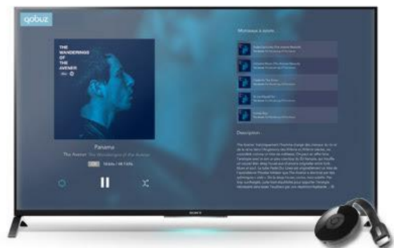
Qobuz auf chromecast

iOS, Android, Windows Phone, Amazon Kindle