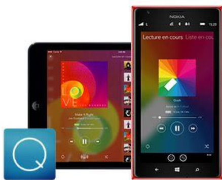
Qobuz auf Smartphones

iOS, Android, Windows Phone, Amazon Kindle